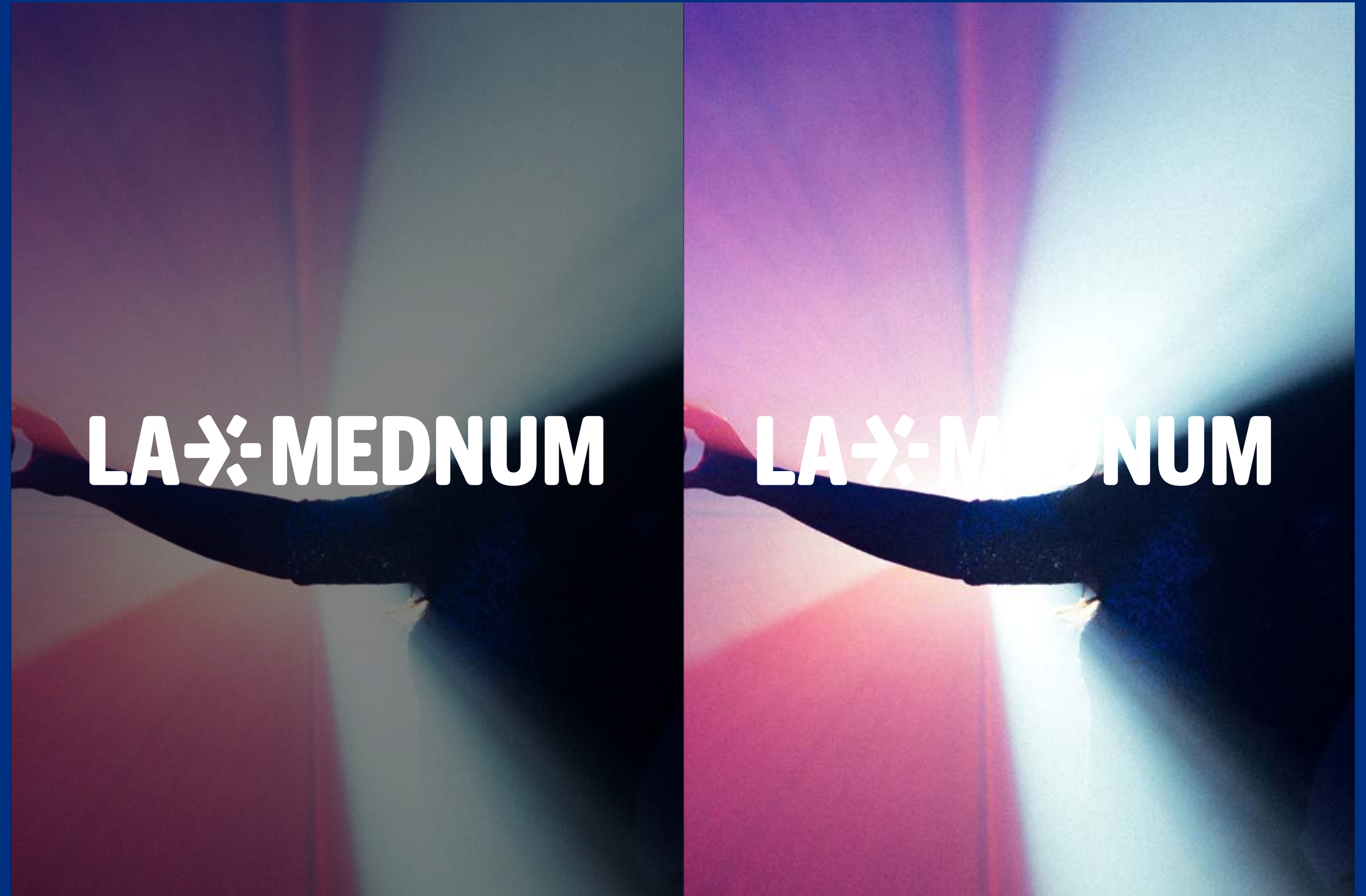
avec filtre assombrissant

Pour faciliter la lisibilité des contenus placés sur les photos, nous recommandons l'usage d'un filtre assombrissant #000000 d'une transparence de 50%