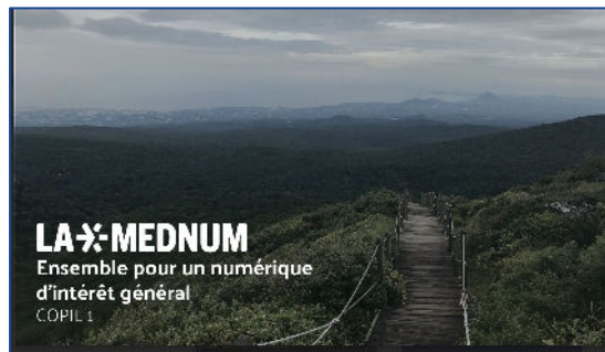
1/ Stratégie Mednum 2025 - document de travail

Retrouvez les présentations évoquées lors de cet échange :